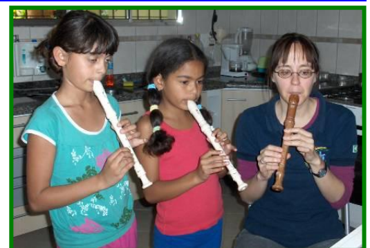
Meine fleissigen Musikschüler ...

... machen auch Fortschritte, einfach langsamer als ich das am Anfang gedacht habe. Zu meiner Freude kann ich aber sagen, dass ich einige sehr gute Gitarrenschüler habe, die wirklich auch üben und dranbleiben. Das macht Spass wenn man ein Lied voll durchspielen kann und nicht immer bei jedem Akkordwechsel anhalten und warten muss, bis sie ihn richtig greifen. Bei meinen Flötenschülerinnen bemerke ich auch eine Veränderung. Am Anfang konnten sie sich kaum 5 min. konzentrieren und sind rumgehampelt. Jetzt können wir schon 20 min. lang Lied um Lied flüssig spielen. Manchmal begleite ich mit der Gitarre - das macht ihnen und mir Freude.