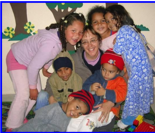
Bei dieser bunten Schar von Kindern, ist immer was los 😊.

...erscheinen auch in diesem Semester treu und zahlreich. Vor allem habe ich viele 3-jährige. Einerseits ist es gut, dass so viele Kleine schon kommen und von Jesus hören. Andererseits ist es dann mit bis zu acht so Kleinen auch recht anspruchsvoll und es fehlt mir oft noch eine helfende Hand mehr. Aber es ist echt toll mit so vielen Kindern und wenn alle wirklich kommen, habe ich morgens wie nachmittags je 20 Kinder (3-6 - jährige).