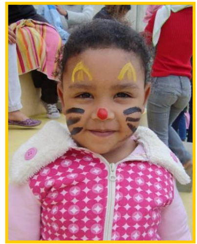
Fröhliche Gesichter am „Kindertag“...

alten Bruder in die Arme, damit sie sich besser um die 2 Jahre alte Schwester besser kümmern konnte. Neben der Schule muss sie für ihre beiden Geschwister aufpassen, die Mutter kümmert sich sehr wenig um die zwei Kleineren. Als sie dann nach Hause kamen, stand die Mutter rauchend und desinteressiert auf der Strasse. Es hat mir wehgetan zu sehen, wie Kinder Verantwortung wie Erwachsenen übernehmen müssen und Erwachsene wiederum überhaupt nicht ihre Verantwortung wahrnehmen und ein resigniertes da sein führen. Es ist leider keine Seltenheit hier, dass die älteren Geschwister sich besser, zeitintensiver und liebevoller um die kleineren Geschwister kümmern als die Eltern. Ihre Kindheit und eine unbeschwerte Zeit gehen dabei aber leider verloren. Klar gibt es auch diese Geschwister, die schnell mal ausrasten, wenn die Kleineren nicht gehorchen und drein schlagen oder rum schreien, oder zerren an ihnen rum, wie wenn sie Puppen wären. Seit Anfangs Semester bringt ebenfalls ein 14 jähriger Bruder regelmässig und immer pünktlich seine 3-jährige Schwester zu uns ins Programm. Er geht wirklich sehr liebevoll mit ihr um. Ein anderes Mädchen bringt mir regelmässig ihre auch 3- jährige Schwester vorbei, gleich nachdem sie selber von der Schule heimkommt.