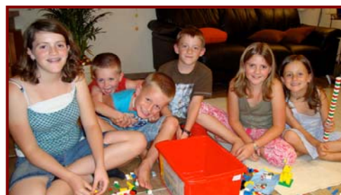
...unsere Kinder geniessen ihre Cousinsen und ihren Cousin...