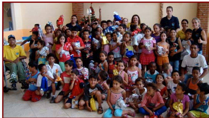
...die „Baleias“ haben das Spezialprogramm an Weihnachten aus vollen Zügen genossen...

...sind gut ins 1. ARCA-Semester 2010 gestartet und auch dieses Jahr freuen wir uns über die durchschnittlich 280 Kinder, Teenager und Mütter, die regelmässig die ARCA-Programme besuchen. Mit der Eröffnung der neuen Kindergruppe „Golfinhos“ („Delphine“, 6 – 8jährige) können wir mehr bedürftige Kinder betreuen und aufgrund der besseren Altersabstufung gezielter auf das Einzelne eingehen. Herzlichen DANK all jenen, die den Bau und die Einrichtung der 3 neuen Kinderräume mit ihrer Unterstützung ermöglicht haben! Die Kinder sind total begeistert und wir natürlich auch ☺!